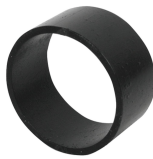
SL RS buis